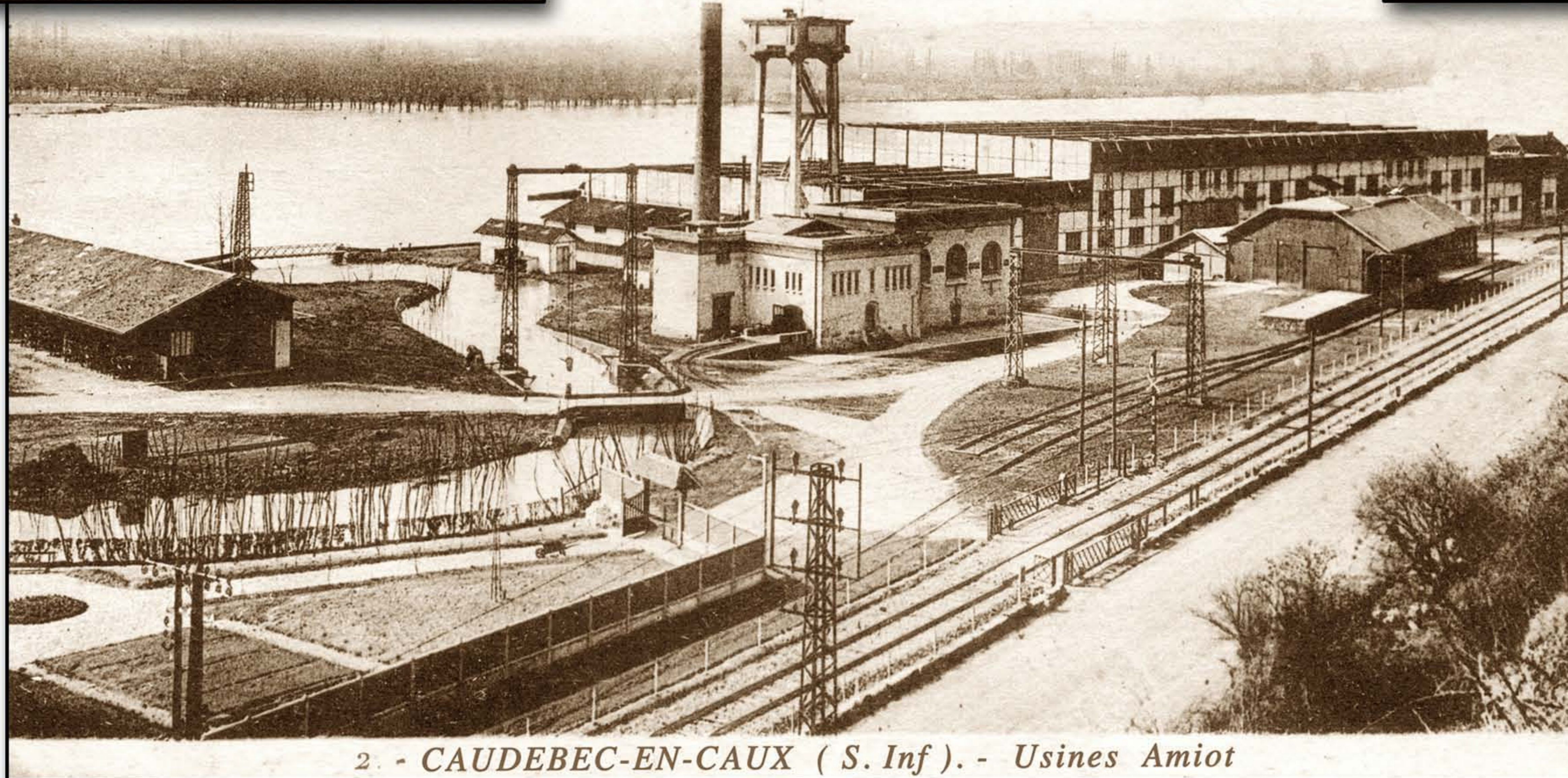
2. - CAUDEBEC-EN-CAUX ( S. Inf ). - Usines Amiot